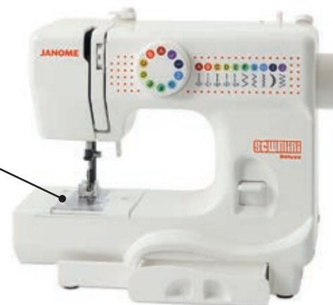
Sew Mini Deluxe

Janome Schoolmate la meccanica a base piana di .."una volta"! Ideale per chi desidera avere la macchina nel mobiletto apposito che offre un grande piano di lavoro.